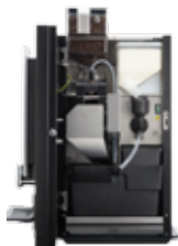
OB 2 (XL) NG