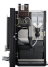
OB 3 (XL) NG